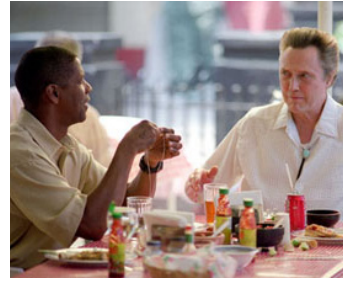
2004 MAN ON FIRE (Men on Fire) de Tony Scott avec Denzel Washington