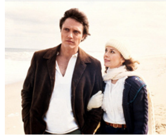
1983 BRAINSTORM (Brainstorm) de Douglas Trumbull avec Natalie Wood