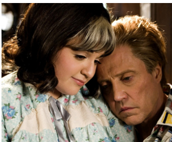
2007 HAIRSPRAY (Hairspray) d'Adam Shankman avec Nicole Bonsky