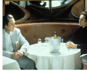
1998 NEW ROSE HOTEL (New Rose Hotel) d'Abel Ferrara avec Willem Dafoe