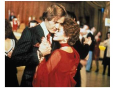
1977 ROSELAND (Roseland, The Hustle) de James Ivory avec Geraldine Chaplin