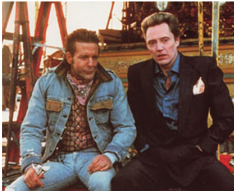
1988 HOMEBOY (Homeboy) de Michael Seresin avec Mickey Rourke