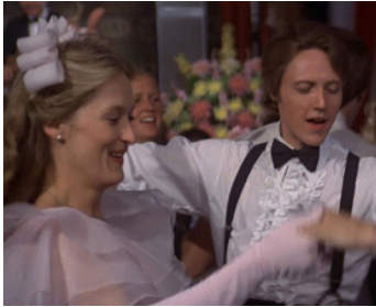
1978 VOYAGE AU BOUT DE L'ENFER (The Deer Hunter) de Michael Cimino avec Meryl Streep