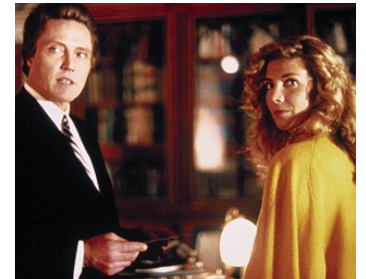
1990 ÉTRANGE SÉDUCTION (The Comfort of Strangers) de Paul Schrader avec Natasha Richardson