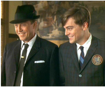
2002 ARRÊTE-MOI SI TU PEUX (Catch me if you can) de Steven Spielberg avec Leonardo Di Caprio