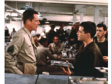
1988 BILOXI BLUES (Biloxi Blues) de Mike Nichols avec Matthew Broderick