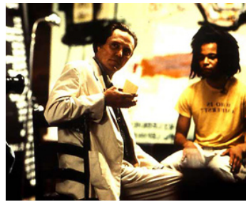
1996 BASQUIAT (Basquiat) de Julian Schnabel avec Jeffrey Wright