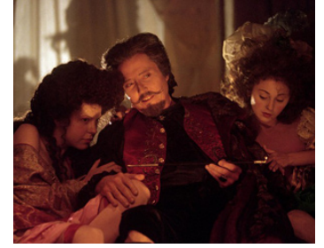
2001 L'AFFAIRE DU COLLIER (The Affair of the Necklace) de Charles Shyer