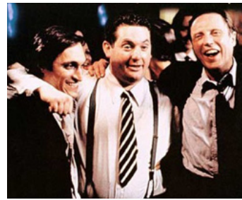
1996 NOS FUNÉRAILLES (The Funeral) d'Abel Ferrara avec Vincent Spano, Chris Penn