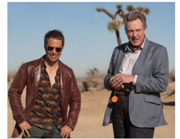
2012 SEPT PSYCHOPATHES (Seven Psychopaths) de Martin McDonagh avec Sam Rockwell