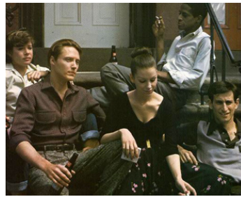
1976 NEXT STOP, GREENWICH VILLAGE de Paul Mazursky avec Lois Smith, Lenny Baker