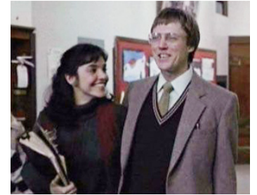
1983 DEAD ZONE (Dead Zone) de David Cronenberg avec Brooke Adams