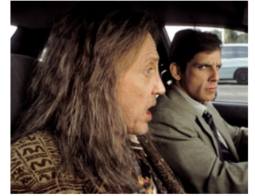
2004 ENVY (Envy) de Barry Levinson avec Ben Stiller