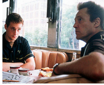
2000 LES OPPORTUNISTES (The Opportunists) de Myles Connell avec Peter Macdonald