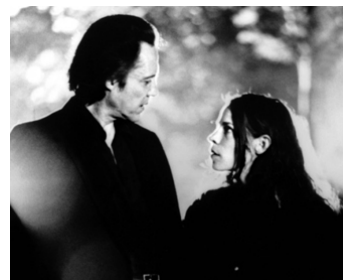
1995 THE ADDICTION (The Addiction) d'Abel Ferrara avec Lili Taylor