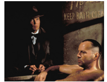
1996 DERNIER RECOURS (Last Man Standing) de Walter Hill avec Bruce Willis