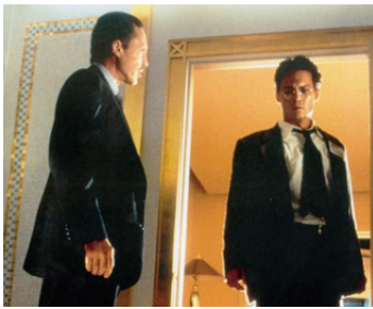
1995 MEURTRE EN SUSPENS (Nick of Time) de John Badham avec Johnny Depp