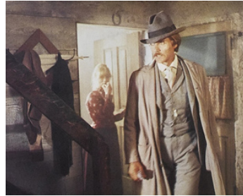
1980 LA PORTE DU PARADIS (Heaven's Gate) de Michael Cimino avec Isabelle Huppert