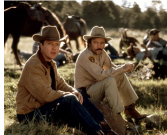
1988 MILAGRO (The Milagro Beanfield War) de Robert Redford avec Ruben Blades