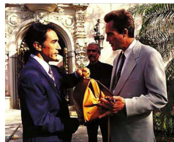
1992 LE GRAND PARDON 2 d'Alexandre Arcady avec Richard Berry