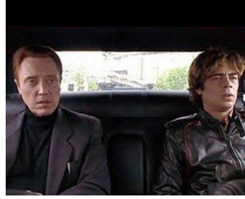
1997 EXCESS BAGGAGE (Excess Baggage) de Marco Brambilla avec Benicio del Toro