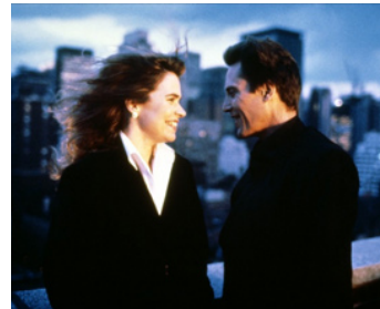
1990 THE KING OF NEW YORK (King of New York) d'Abel Ferrara avec Janet Julian