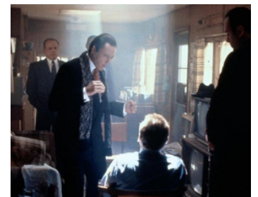
1993 TRUE ROMANCE (True Romance) de Tony Scott