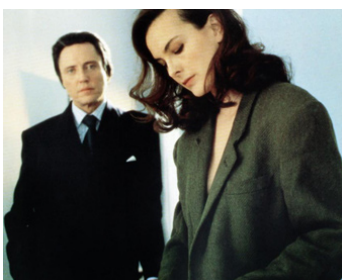
1994 D'UNE FEMME À L'AUTRE de Charlotte Brainstorm avec Carole Bouquet