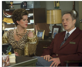
2009 UN PLAN D'ENFER (The Maiden Heist) de Peter Hewitt avec Marcia Gay Harden