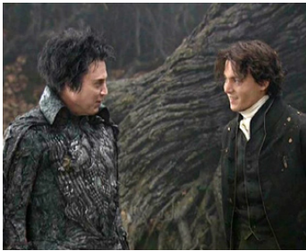
1999 SLEEPY HOLLOW (Sleepy Hollow) de Tim Burton avec Johnny Depp