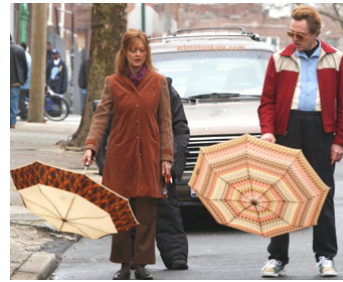
2005 ROMANCE AND CIGARETTES de John Turturro avec Susan Sarandon