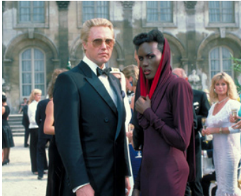
1985 DANGEREUSEMENT VÔTRE (A View to a Kill) de John Glen avec Grace Jones