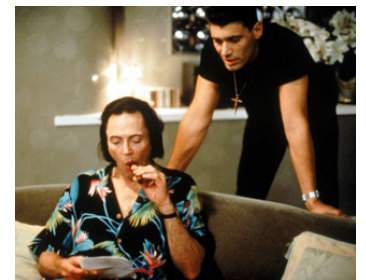
1995 WILD SIDE (Wild Side) de Donald Cammell avec Steven Bauer