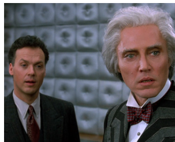
1992 BATMAN, LE DÉFI (Batman Returns) de Tim Burton avec Michael Keaton