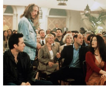
2001 COUPLE DE STARS (America's Sweethearts) de Joe Roth avec J. Cusack, Catherine Zeta-Jones