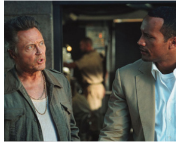
2003 BIENVENUE DANS LA JUNGLE (The Rundown) de Peter Berg avec Dwayne Johnson