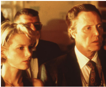
1997 TOUCH (Touch) de Paul Schrader avec Bridget Fonda