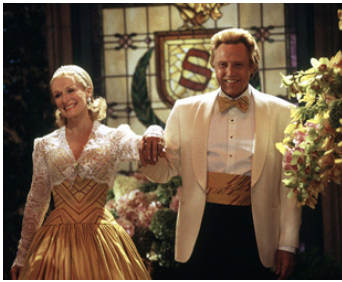
2004 ET L'HOMME CRÉA LA FEMME (The Stepford Wives) de Frank Oz avec Glenn Close