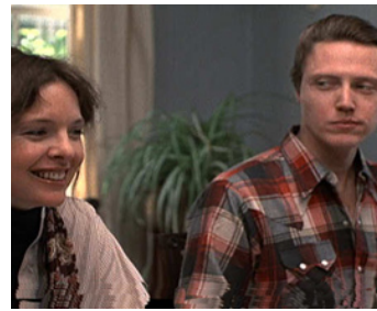
1977 ANNIE HALL (Annie Hall) de Woody Allen avec Diane Keaton