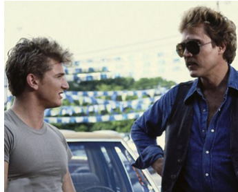
1986 COMME UN CHIEN ENRAGÉ (At Close Range) de James Foley avec Sean Penn