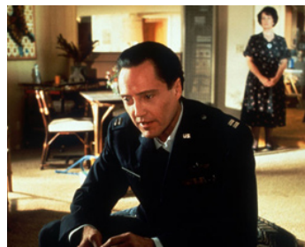
1994 PULP FICTION (Pulp Fiction) de Quentin Tarantino avec Brenda Hillhouse