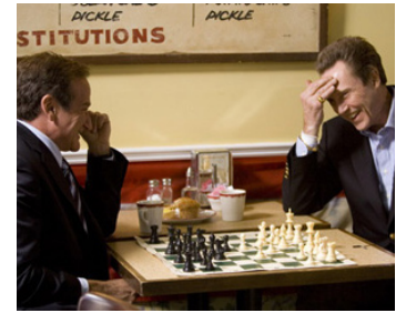
2006 MAN OF THE YEAR (Man of the Year) de Barry Levinson avec Robin Williams