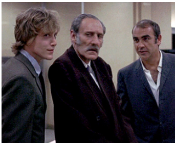
1971 LE DOSSIER ANDERSON (The Anderson Tapes) de Sidney Lumet avec Sean Connery