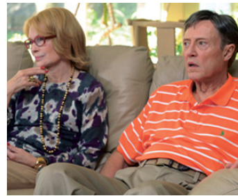
2011 DARK HORSE (Dark Horse) de Todd Solondz avec Mia Farrow