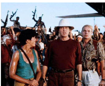
1991 McBAIN (McBain) de James Glickenhaus avec Michael Ironside, Maria Conchita Alonso